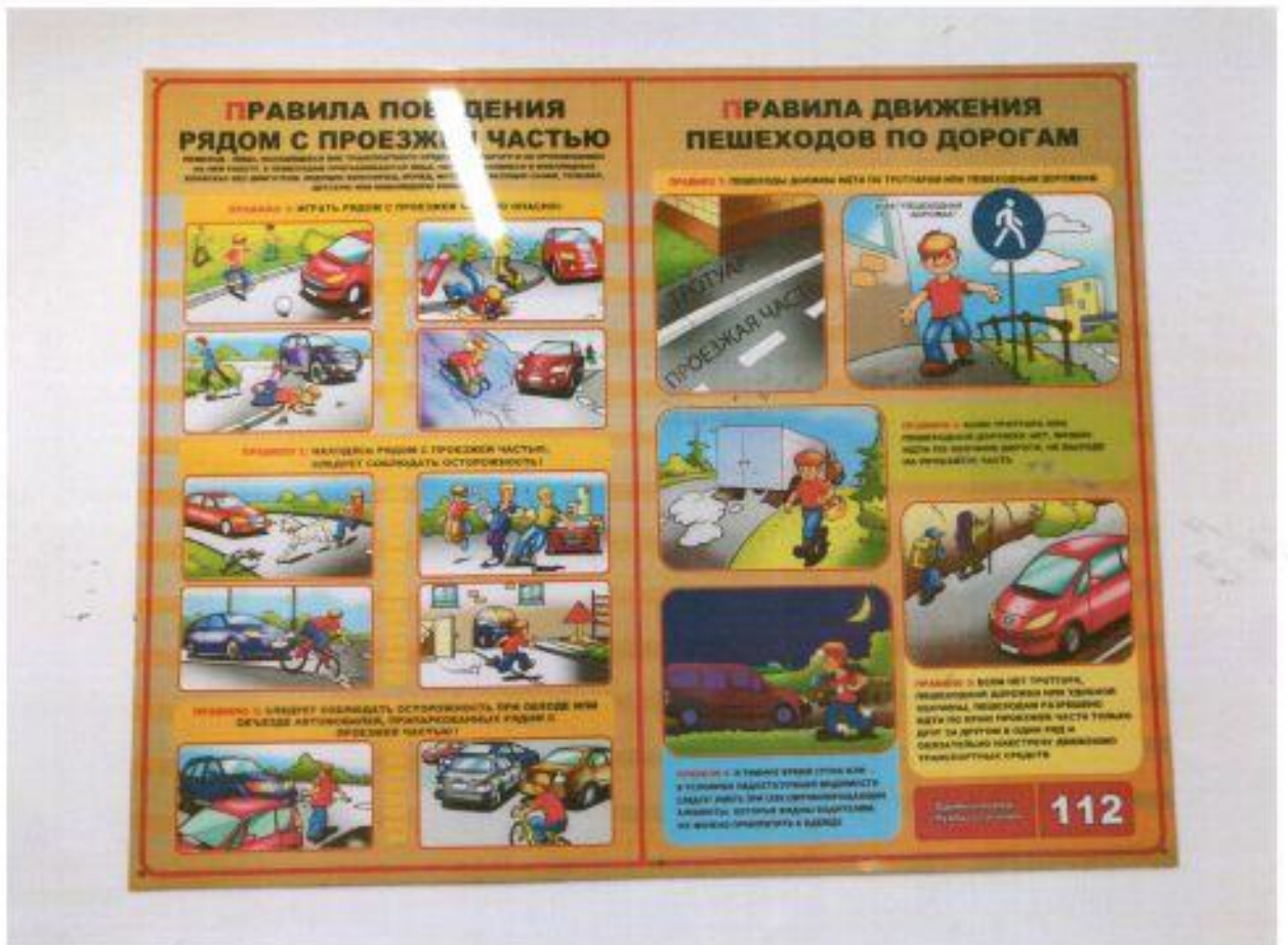
Фото №1 уголок безопасности дорожного движения ДШИ им. Поленовой (г.Хотьково)