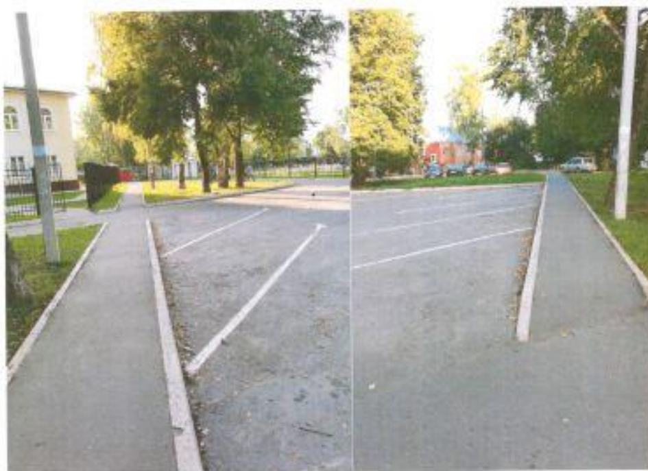
Фото №3,4 Вход в школу и ближайшая от входа стоянка автотранспорта.