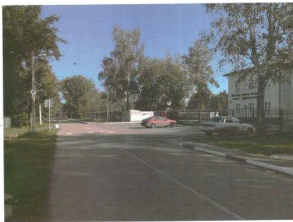
Фото №2 Вид на школу, перекресток, тротуар, автостоянку, искусственную неровность, зону разгрузки, парк "Покровский."

Случаев дорожно-транспортных происшествий с участием детей-пешеходов и детей-велосипедистов не было.